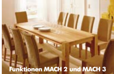
Funktionen MACH 2 und MACH 3