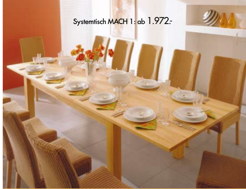
Systemtisch MACH 1: ab 1.972,-