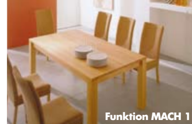
Funktion MACH 1