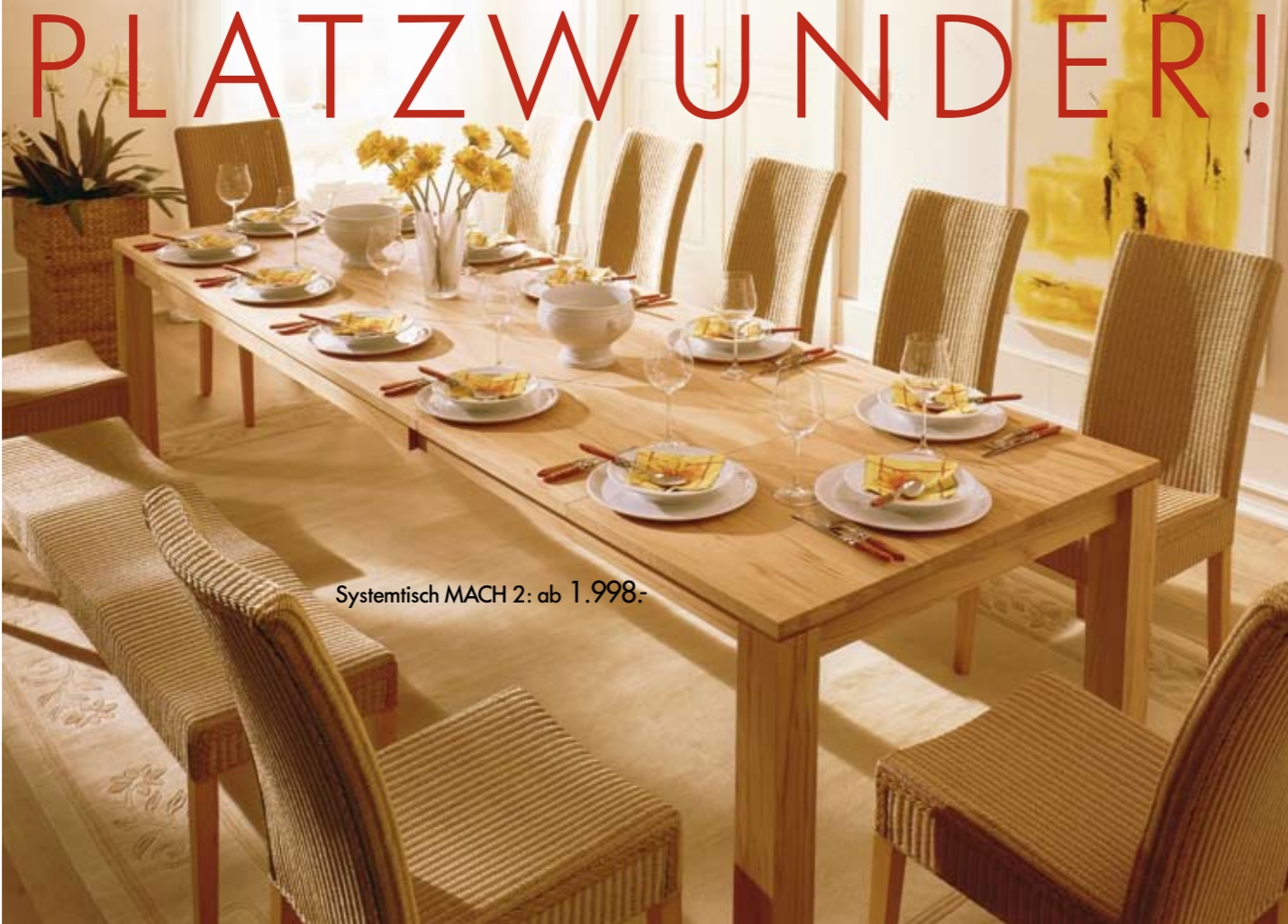
Systemtisch MACH 2: ab 1.998,-